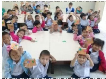
เตรียมการ์ดอวยพร ปีใหม่ให้ คุณพ่อ คุณแม่