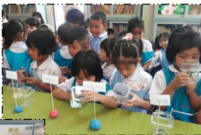
ให้ความสนใจใน การเรียนรู้จาก ของจริง