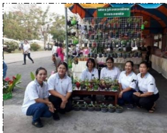
จัดแสดงนิทรรศการ ผลงานเด็ก