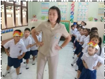
สนุกสนานมี ความสุขกับ เสียงเพลง